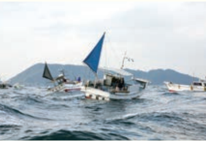
早吸瀬戸の一本釣り漁場

なぜ回遊せずに瀬に居着くのか、理由ははっきりとはわかっていません。しかし、前述のとおり佐賀関沖の漁場の特徴として海底の地形や海流の影響などが関係し、一年を通じて海水の温度が安定しており、豊富な餌を食べることが出来る海域の特性だと考えられています。