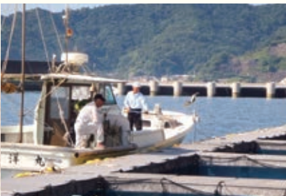
佐賀関漁港での面買の様子